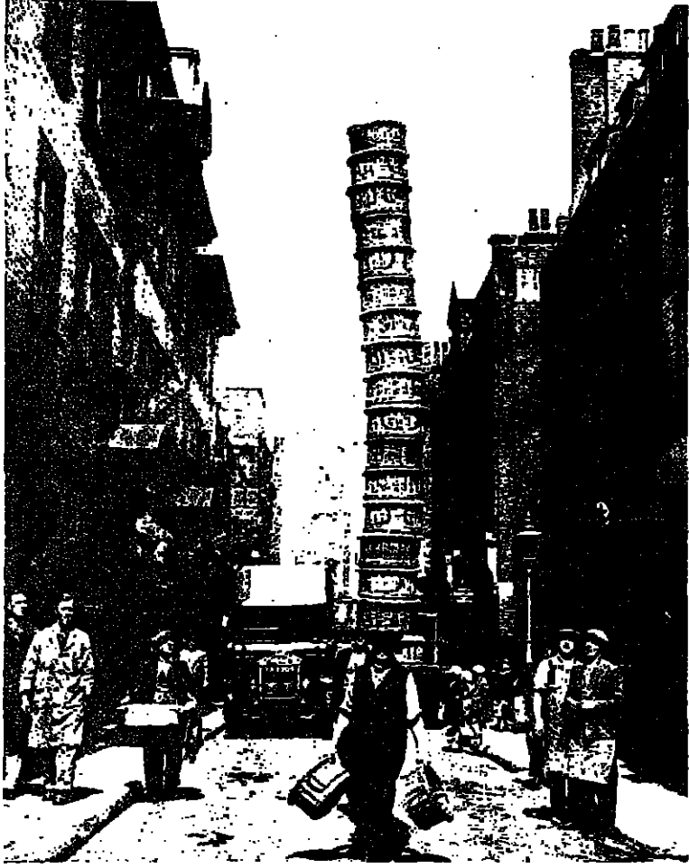
هذا ليس برج بيزا

انه احد الحملين يحمل على رأسه 16 سلة من الفواكه .. واين ؟ في مدينة لندن ، سوق كوفنت غاردن ..